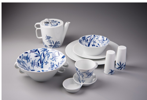
Soupravu Bohemia Cobalt od Jiřího Pelcla vyrobila porcelánka Český porcelán Dubí, a. s. roku 2020

Autora soupravy Bohemia Cobalt známe, je jím přední český designér, architekt Jiří Pelcl, jehož záměr byl zcela odlišný: souprava Bohemia Cobalt je určena pro každý stůl! Moderní tvar nádobí je ale vyzdoben prastarou technikou, malbou kobaltem pod glazurou. Dekor okopírovali výrobci v Evropě již na počátku 18. století z čínských vzorů. Granátová jablka z čínské předlohy však Evropanům připomínala cibuli, a tak dekor dostal název „cibulový“. Cibulákové soupravy byly oblíbené u vašich i našich babiček. Jiří Pelcl navrhl soupravu s velmi podobným vzorem, která však má velmi jednoduchý, moderní a praktický tvar. Která ze souprav se by vám více líbila?