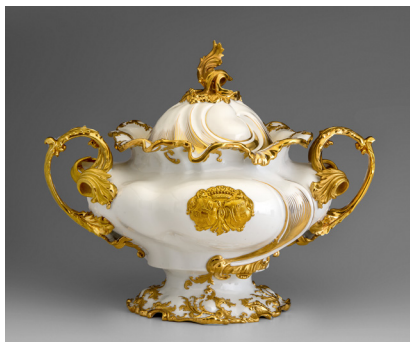
Terinu (mísu na polévku) z Thunské jídelní soupravy vyrobila porcelánka v Klášterci nad Ohří roku 1856

prostřeli jsme náš stůl dvěma soupravami, které vznikly s odstupem více než 150 let. Obě vypovídají o době svého vzniku i nárocích na stolování. Prohlédněte si, jaké nádoby jsme použili a zamyslete se nad tím, které z nich používáte běžně a které se z našeho stolování vytratil. Zkuste se zamyslet i nad tím, které předměty jsou vhodné pro slavnostní stolování a které pro denní užití. Poznáte, jaký typ porcelánového nádobí není vhodné dávat do myčky nebo mikrovlnky? A proč?