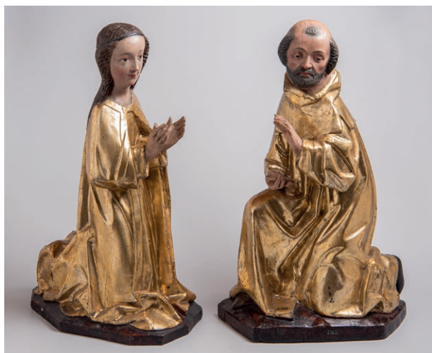
Obr. č. 3 – Plzeň, sousoší Narození Páně. Západočeské muzeum v Plzni, uměleckopřemyslové oddělení. Foto V. Marian 2024.

Tradice zobrazování scény Narození Páně 7 sahá až do prvních století našeho letopočtu. Byla velmi častým námětem středověkých umělců. Věnovali se jí spíše malíři, například v bližším prostředí se stala běžnou ikonografickou výbavou zvláště norimberských malovaných oltářů zasvěcených Panně Marii. Méně se s ní setkáváme ve formě volných dřevěných soch. Je to možná tím, že s nimi bylo více manipulováno nebo byly možná zasazeny do exteriérového krajinného či architektonického rámce, a tak došlo k jejich poškození. Tak je vysvětlována i absence Ježíška ze sečského sousoší. 8