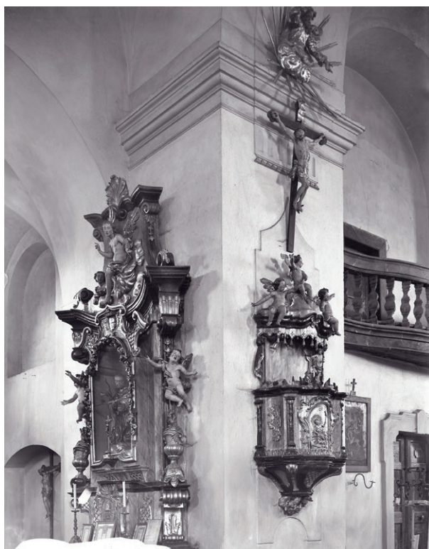
Obr. č. 4 – Seč, kostel Nanebevzetí Panny Marie, oltář sv. Josefa. Západočeské muzeum v Plzni, oddělení novějších dějin. Foto F. Macháček 1917.

V roce 1722 je zmiňován samostatný oltář sv. Josefa. 14 Není však uvedeno, jaká byla jeho sochařská výzdoba. Světlo do problematiky vnesla až nedávno publikovaná reprodukce historického