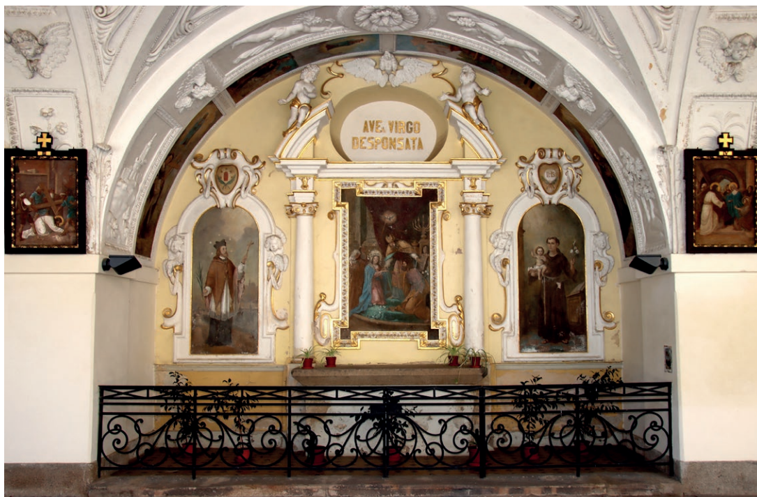
Obr. č. 9 – Svatá Hora, kaple Zasnoubení Panny Marie.

a dominikánů. Od roku 1969 je svátek dovolen pouze v kostelích tohoto zasvěcení. 34