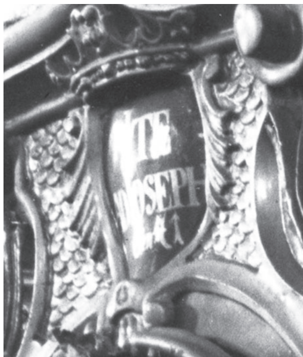
Obr. č. 6 - Seč, kostel Nanebevzetí Panny Marie, oltář sv. Josefa, výřez s nápisem. Západočeské muzeum v Plzni, oddělení novějších dějin. Foto F. Macháček 1917.