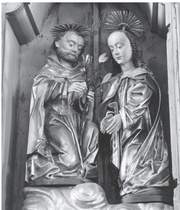
Obr. č. 5 - Seč, kostel Nanebevzetí Panny Marie, sousoší Narození Páně (Zasnoubení Panny Marie). Fotoarchiv NPÚ, ÚOP v Plzni. Foto J. Gryc 1975.