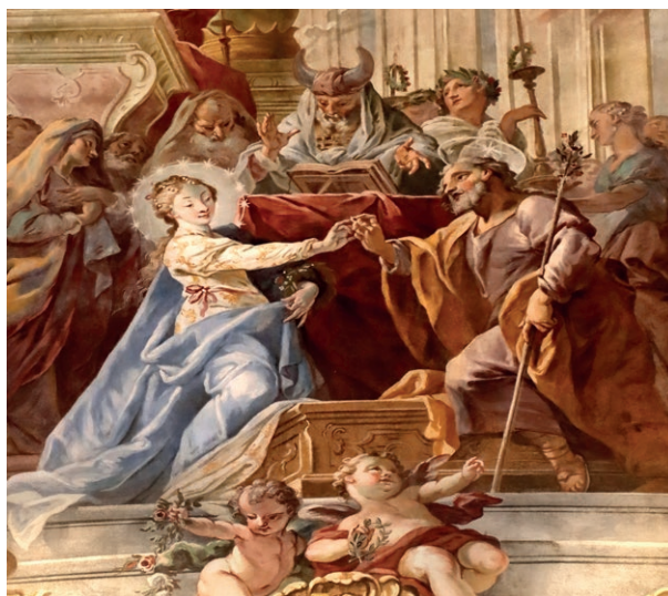
Obr. č. 10 – Domažlice, kostel Narození Panny Marie, nástěnný obraz Zasnoubení Panny Marie. František Julius Lux.

Na území plzeňské diecéze je kompozice soch Zasnoubení Panny Marie zřejmě ojedinělá. Nenajdeme zde ani kostely či kaple s tímto zasvěcením. 37 I na celém našem území nenajdeme mnoho