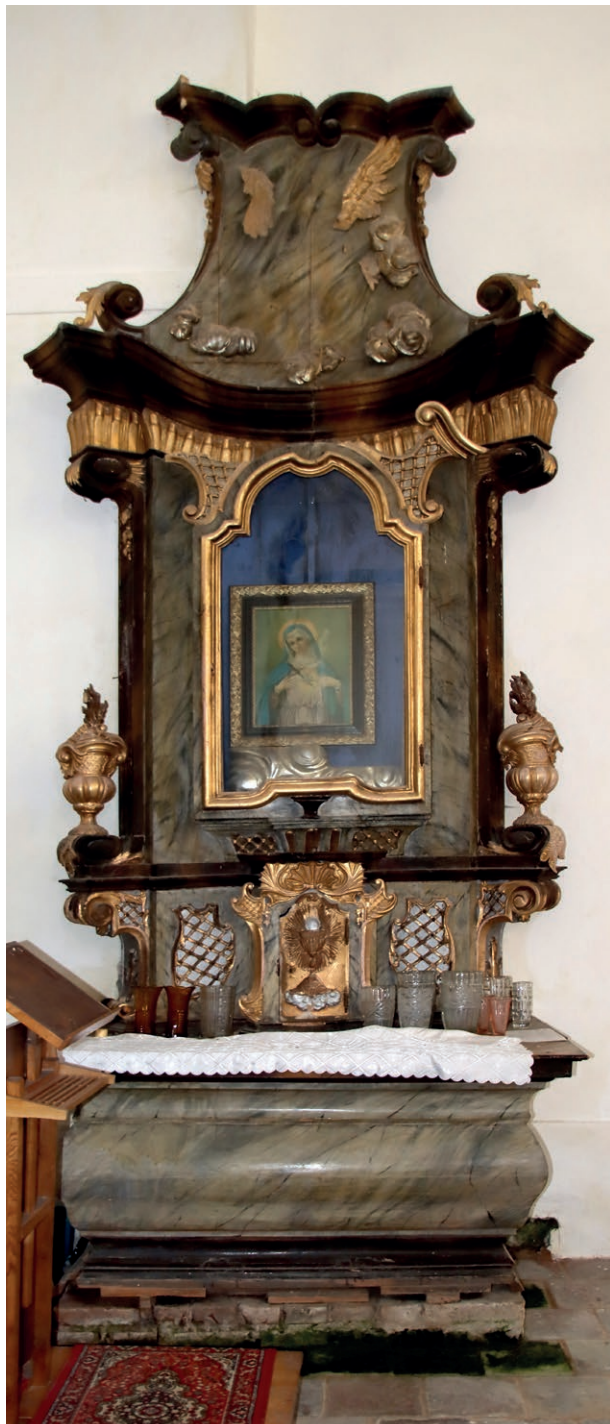
Obr. č. 8 – Seč, oltář sv. Josefa.