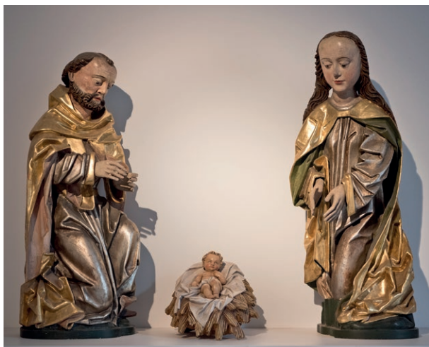
Obr. č. 1 – Plzeň, Muzeum církevního umění plzeňské diecéze v Plzni, sousoší Narození Páně ze Seče. Foto V. Marian 2020.

V expozici Muzea církevního umění plzeňské diecéze v Plzni je vystaveno sousoší Narození Páně, které je důležitou součástí části věnované životu Ježíše Krista (východní křídlo ambitu), kde připomíná jeho narození (obr. č. 1). Pochází z původně gotického a později barokně přestavěného kostela Nanebevzetí Panny Marie v Seči (obr. č. 2). 1 V expozici je popsáno jako Skupina Narození Krista, Panna Maria a sv. Josef, Plzeňsko, okolo 1480, lipové dřevo, polychromie, mladší zlacení. 2 Pro názornost je zde doplněno o sošku narozeného Ježíška v jesličkách z roku 1941 od Františka Charváta. 3