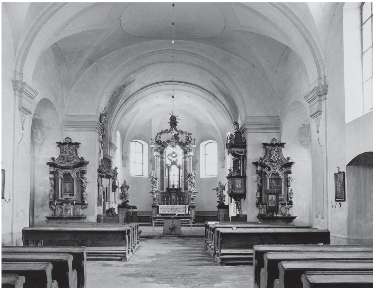
Obr. č. 7 - Seč, kostel Nanebevzetí Panny Marie, oltář sv. Josefa (levý boční) na celkovém záběru interiéru směrem k hlavnímu oltáři. Fotoarchiv NPÚ, ÚOP v Plzni. Foto J. Gryc 1992.