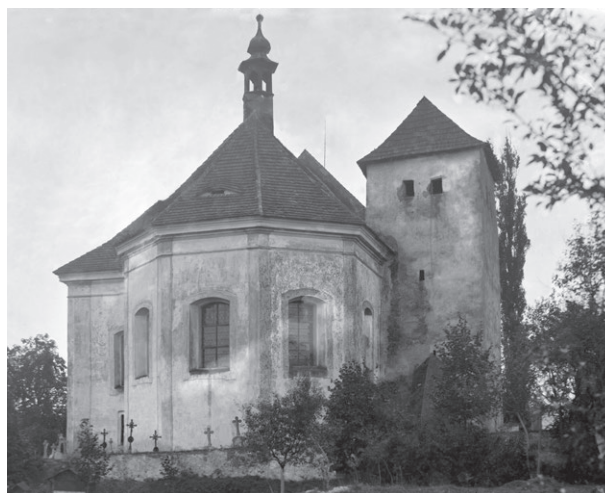
Obr. č. 2 – Seč, kostel Nanebevzetí Panny Marie. Západočeské muzeum v Plzni, oddělení novějších dějin. Foto F. Macháček 1917.

Z umělecko-historického hlediska je pak podrobněji popsáno jako sousoší Narození Páně, kolem 1475–1480, lipové dřevo, (Panna Marie) 83 cm, (sv. Josef) 81 cm, vzadu vyhloubené, starší polychromie (inkarnáty) s mladším zlacením, konzervováno v roce 1995. 4 Dále je k němu uváděno, že obě sochy, představující sv. Josefa a Pannu Marii, spolu tvořily se ztracenou postavou ležícího Ježíška kdysi scénu Narození Páně, která zřejmě zdobila skříň oltářní archy. Vznik sošek je připisován pravděpodobně lokální, nejspíše plzeňské dílně. Autorem byl zkušený sochař, který vytvořil sousoší pod silným vlivem norimberského umění 3. čtvrtiny 15. století. Obě klečící postavy jsou srovnávány s dalším ikonograficky totožným sousoším Narození Páně ze západních Čech z doby kolem období 1450–1460, kterému také chybí Ježíšek (obr. č. 3). 5 Mají s ním příbuznou kompoziční sestavu a snad i jihoněmecký slohový původ. 6